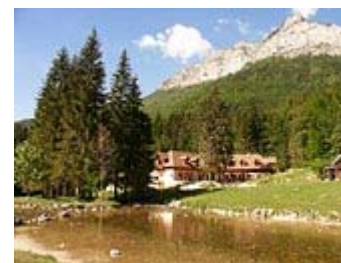
aperçu du lieu de stage